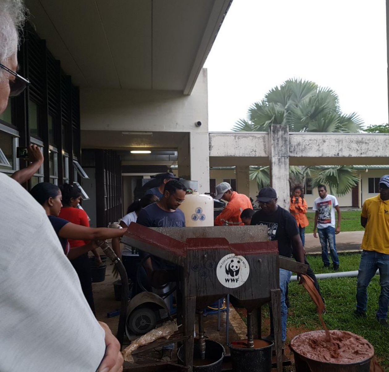
JIG MINERALEN CONCENTRATOR IN OPERATIE