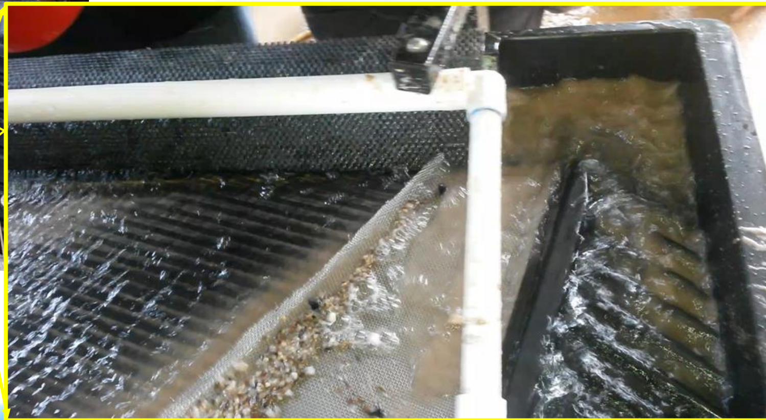
SCHEIDING PROCES DOOR GEBRUIK TE MAKEN VAN SCHUDTAFEL