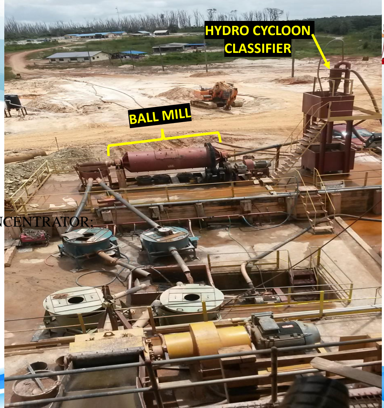
N.V. GRASSALCO GRAVITY PLANT TE MARIPASTON