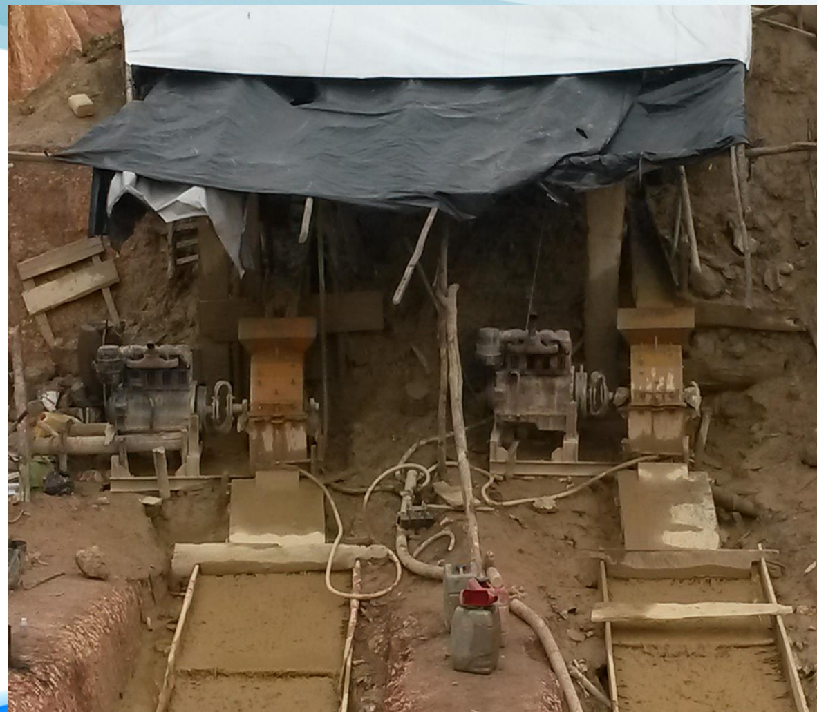
SCREEN, CLASSIFIER EN CENTRIFUGALE CONCENTRATOR