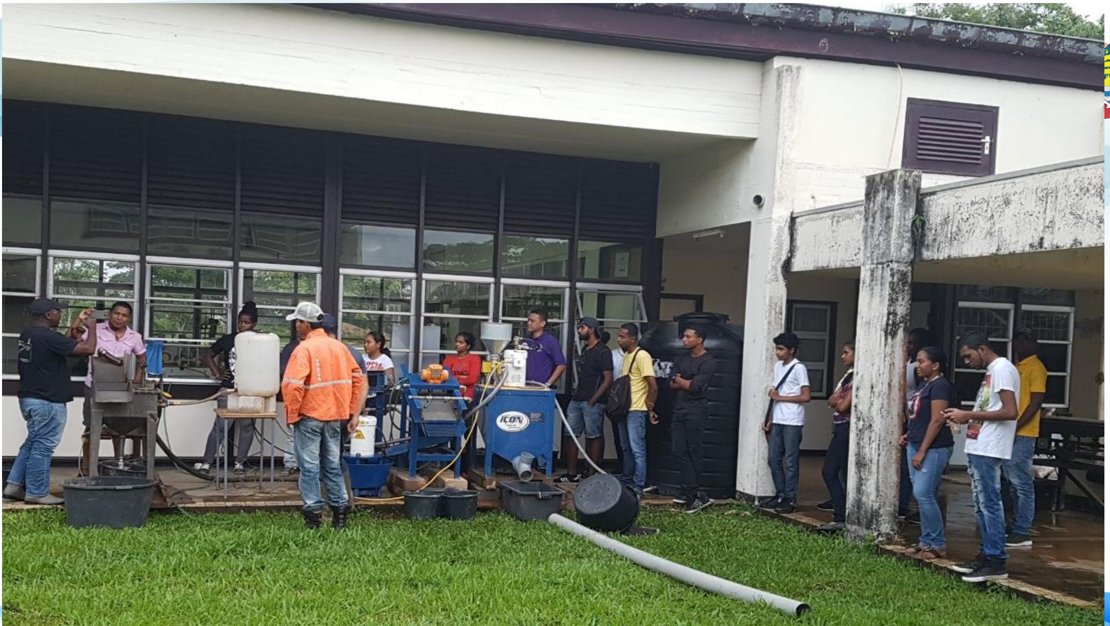
OVERZICHT OVER VAN EEN JIG - AND ICON CONCENTRATOR CIRCUIT (universiteit complex leysweg)