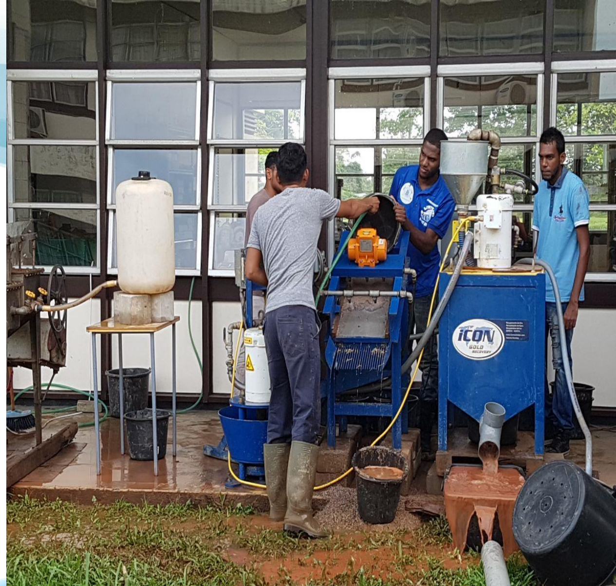
ICON CENTRIFUGALE CONCENTRATOR IN OPERATIE