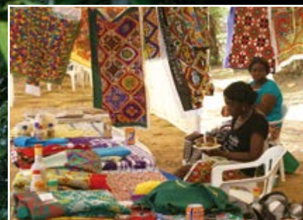
Structuration de micro-filières économiques locales.

RETOMBÉES DIRECTES ET INDIRECTES POUR LES TERRITOIRES DE 2007 À 2013