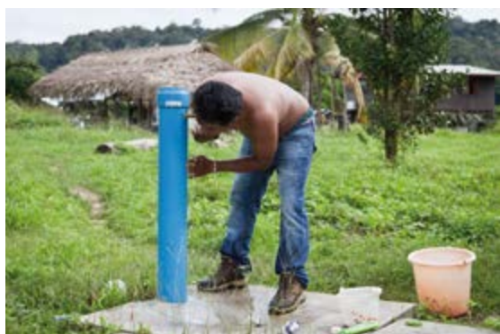
Amélioration des équipements d'alimentation en eau potable des villages du Haut-Maroni. Maîtrise d'ouvrage : commune de Maripa-Soula. Montant : 430.000€