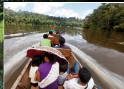
Appui aux créateurs d'entreprises.