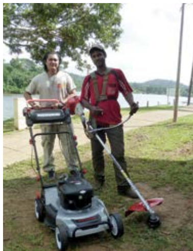
Dispositif Micro projet GAL Sud porté par le PAG : accompagnement à la création de très petites entreprises.