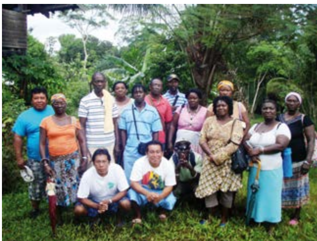
Professionalisation et formation des agriculteurs du Marani (Etablissement d'enseignement et de formation agricole de Matiti).