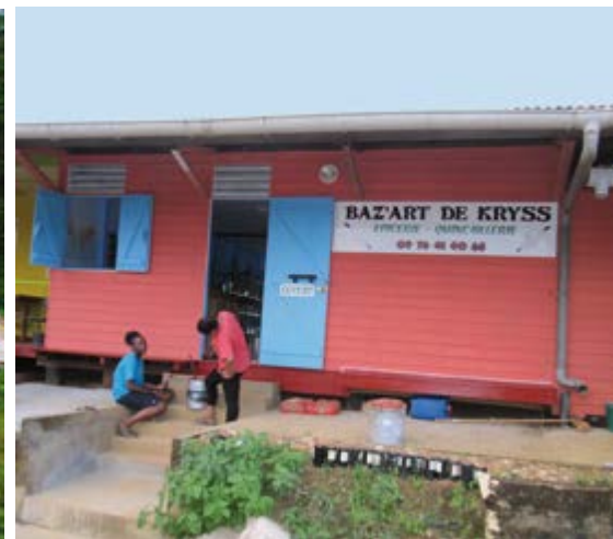
Création d'un commerce multi-service à Saül.