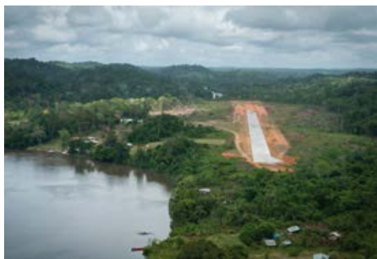
Mise en dur de la piste d'aérodrome de Camopi. Maîtrise d'ouvrage : Conseil général. Montants : 6.000.000€