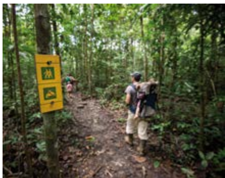
Réhabilitation des sentiers de Saül.