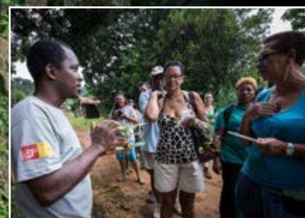
Animation sur les patrimoines naturels et culturels