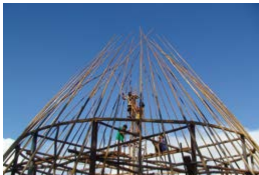
Aide à la reconstruction du tukusipan, carbet communautaire de Taluen.