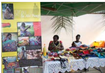
Promotion de l'artisanat : ici lors du marché artisanal de Maripa-Soula organisé par le Parc amazonien de Guyane et la Mairie.