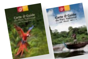
Promotion touristique des territoires à travers des documents à destination du grand public.