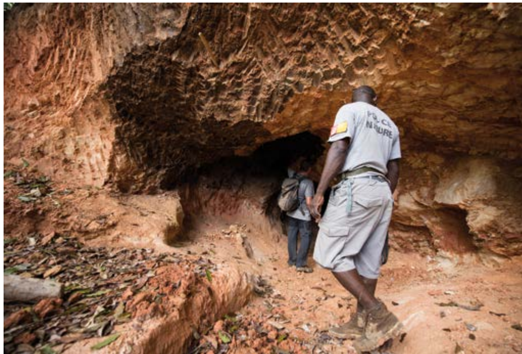
Agents de la brigade nature du Parc national découvrant un site d'orpaillage primaire.