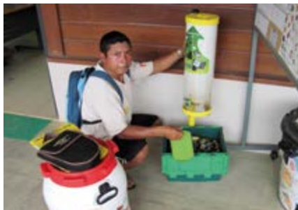
Soutien à la filière de recyclage des piles usagées, à Camopi.