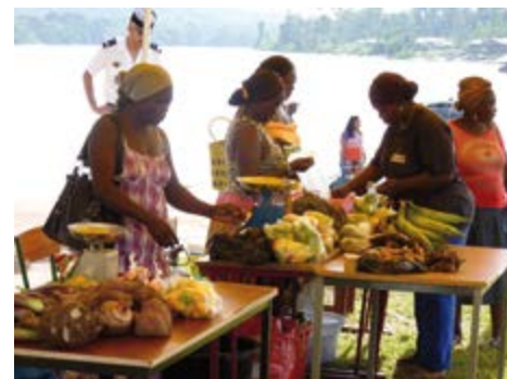
Aménagement d'un marché des producteurs dans le bourg de Maripa-Soula.